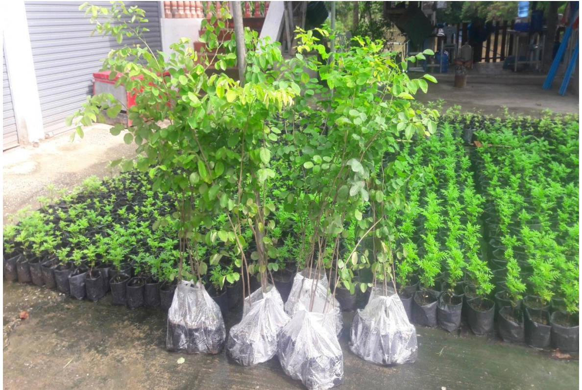
ภาพถ่ายการดำเนินการโครงการ “พยุงธรรม ค้าไทย ถวายองค์ราชินี”